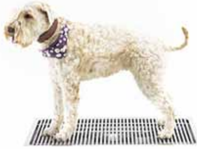
Kurasyöppö Midi 500 x 800 mm