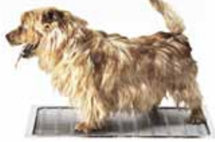
Kurasyöppö Mini 400 x 600 mm