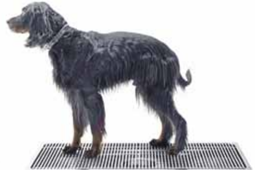
Kurasyöppö Maxi 600 x 1200 mm