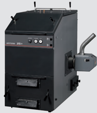
Arterm 35+ varustettuna Axon-pellettipolttimella